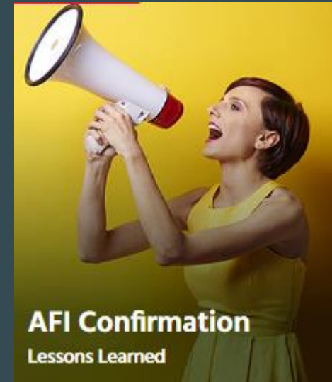
AFI Confirmation Lessons Learned

Digitale, automatisierte Verarbeitung und Kontrolle von eingehenden Auftragsbestätigungen in SAP