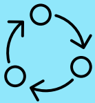
Abbildung dokumentenbasierter Prozess durch Suche von Metadaten.